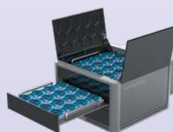
ROTOMATION mannlos durch die Nacht