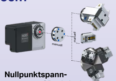
Nullpunktspannsystem auf Drehtisch schnelles Umrüsten garantiert