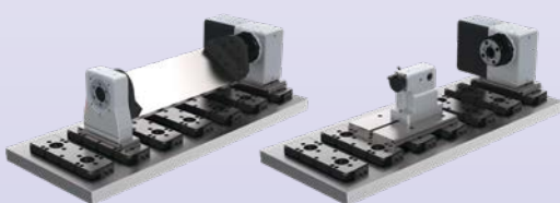
Nullpunktspannsystem auf Maschinentisch schnelles Umsrüten garantiert